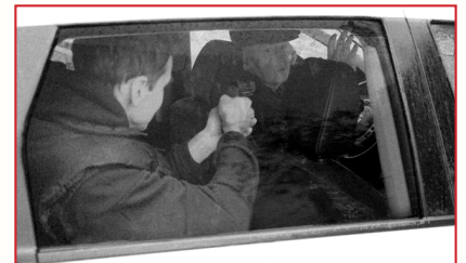
Вид автомобиля с тонированными стеклами при использовании системы «ТОН» производства «ЭВС».